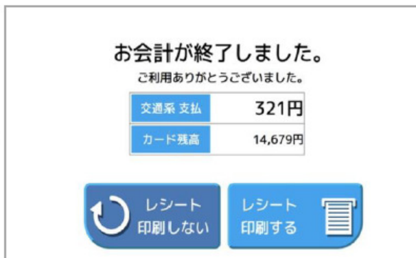
⑤ レシートを「印刷する」か「印刷しない」を選ぶ 印刷しない場合は、商品を持って買い物完了