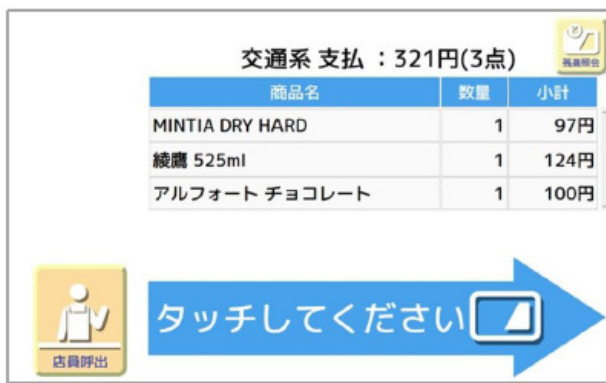
③ 画面に表示された商品を確認