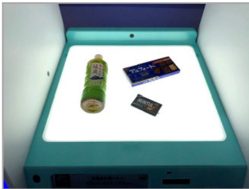
① 商品ラベルを上に向けてワンダーレジの中に置く