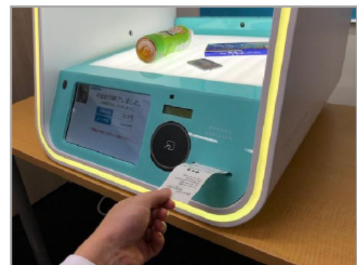
⑥ 「印刷する」を選んだ場合は、レシートを取って商品を持ったら買い物完了