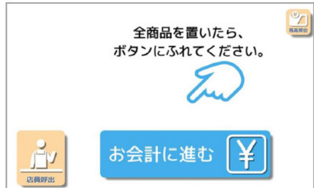
② 「お会計に進む」を押す