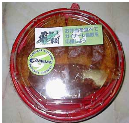
「ガイナレがいなチキンカツ丼」