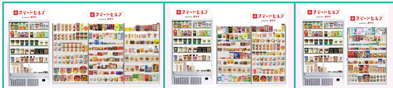
標準仕様 常温品3本+冷蔵品1本