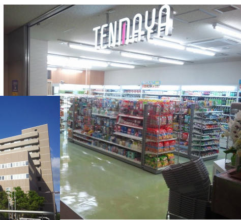
天満屋岡山医療センター店